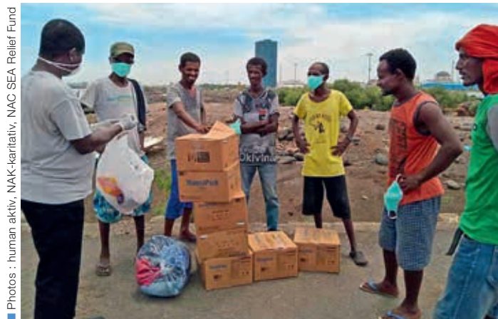
Un projet d'alimentation de « NAK-karitativ » (ÉNA d'Allemagne) crée des moyens de subsistance