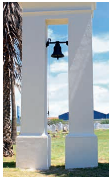
Inaugurée en 1820 par l'Église réformée néerlandaise, déclarée patrimoine provincial en l'an 2000 et utilisée par l'Église néo-apostolique depuis 2014

En 1817, quelques paysans ont demandé l'autorisation au Gouverneur Lord Charles Somerset d'ériger une église dans la région montagneuse de Helderberg ainsi qu'un village autour de celle-ci. La demande a été acceptée et la construction de l'église a démarré en 1819. L'édifice a été inauguré le 13 février 1820.