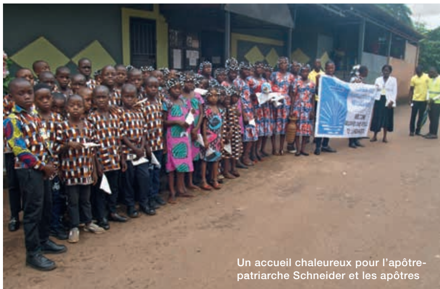
Un accueil chaleureux pour l'apôtre-patriarche Schneider et les apôtres