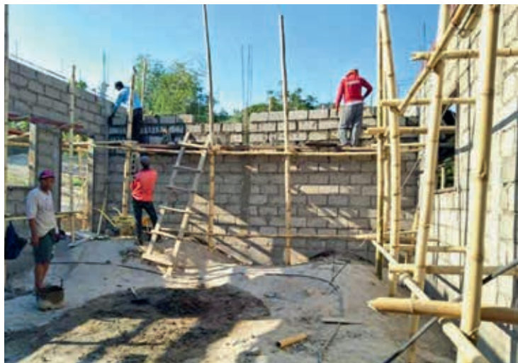
Construction avec l'aide de « NAC SEA Relief Fund » (ÉNA d'Asie du Sud-Est)